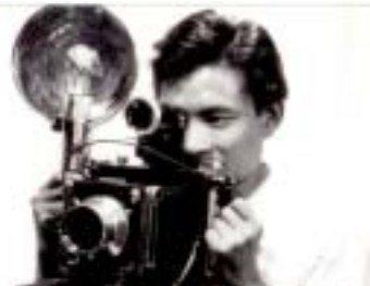
報道カメラマン当時の若き筆者

パラナバイの町は建設途上で、中央をやたらに広い大通りが貫き、両側に西部劇を思わせる様な商店がポツリポツリと建つ、何となくホコリっぽい町であったと記憶している。その日も取材を終え冷えたビールを飲んで、隣のテーブルに恰幅の良いつるつる頭にベレー帽を乗せた男が居り、どこかで見た顔だが思い出せなかった。やがて私の前にドツカと腰を下ろし「あんた、ソルテイロ(独身)か」と、いきなり話しかけてきた。「エエ・・・まア・・・」と私。